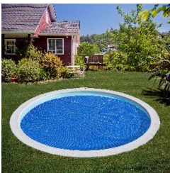
CVPE420 Sommer Abdeckplanne Summer Cover