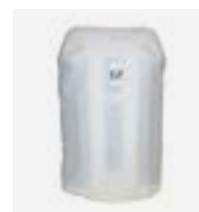
Sacca di protezione invernale