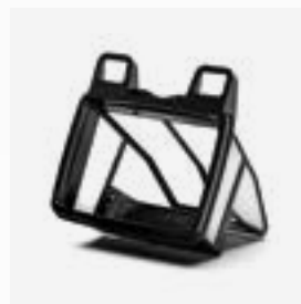
Filterkorb Filtration 100µ