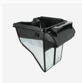
Filtro rectangular Filtro simple de 100µ