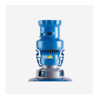
Régulateur de débit (robot)