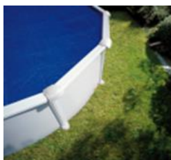
CV450 Couverture isotherme Isothermische afdekking