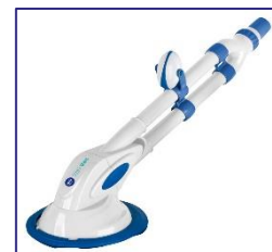
Nettoyeurs automatiques Automatische zwembadreiniger