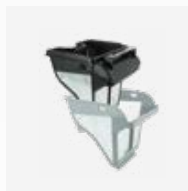
Filtro rígido Filtro de nível duplo: 150/60 µ