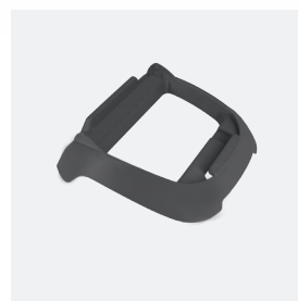
Socle pour boîtier de commande