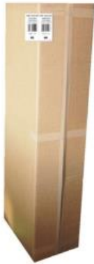
2 etiquetas arriba, en lados opuestos y sin la costura de la caja