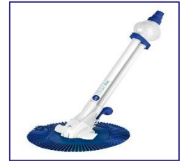
Automatischer Reiniger Automatic cleaner