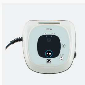
Scatola di comando