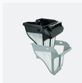
Vasca filtrante Filtro a due stadi: 150/60 µ