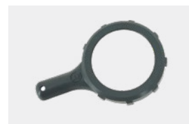
Llave apriete célula