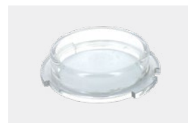
Tapón de invierno

Los cloradores salinos son una solución de desinfección automática y eficaz . Son fáciles de utilizar y se obtiene un tratamiento del agua completo y un mantenimiento reducido .