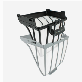
Hoofdfilter 150 µ voor dubbele filtering of alleenstaand gebruik

Overfilter voor zeer fijne vuildeeltjes 60 µ voor gebruik bij dubbele filtering