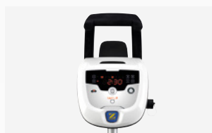
Quadro di comando