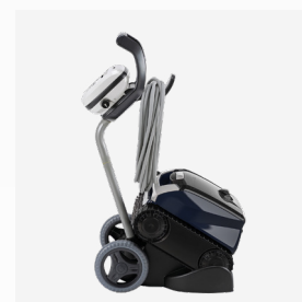
Carro de transporte