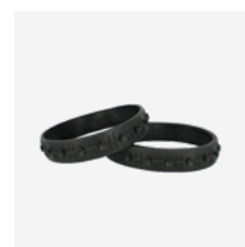
Wielband voor bescherming van de zwembadtegels