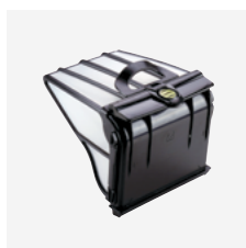
Filterbak (5 liter) Stevig, zeer fijn filter met grote inhoud