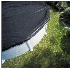
CIPR241 Couverture d'hiver Winterafdekking