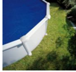
CV250 Couverture isotherme Isothermische afdekking