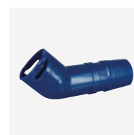
Langwerpige draaiende 45° elleboog