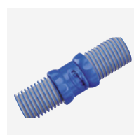
'Twist Lock' -leidingen