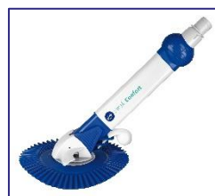
Nettoyeurs automatiques Automatische zwembadreiniger