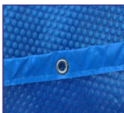
CVKPCO52 Couverture isotherme Isothermische afdekking