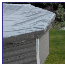
CIKPCO52 Couverture hivernale Winterdekking