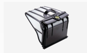
Bac filtrant 5 litres Facile d'accès et de grande capacité