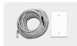
Kit bediening op afstand