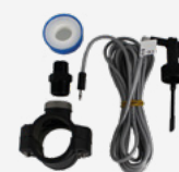
Kit détecteur de débit