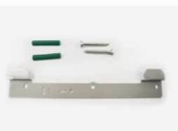
Kit fixation murale