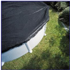
CIPR351 / CIPR351P Winterabdeckung Winter cover