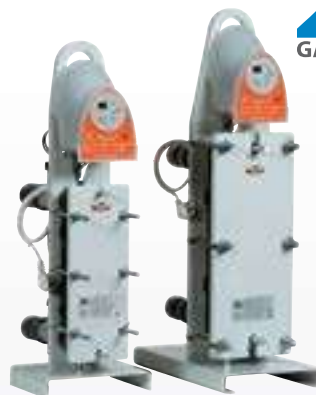
Uranus de placas de titanio montado