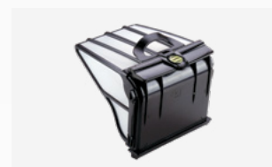
Filterbak (5 liter) Stevig, zeer fijn filter met grote inhoud