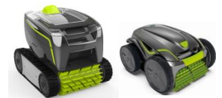
Roboter Robot GT3220/GV3420