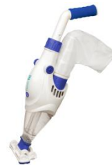
Elektrischer Bodenreinger Electric vacuum VCB10