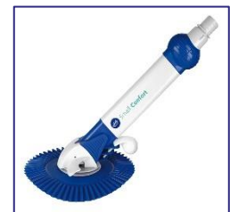
Automatische Boden Reiniger Automatic cleaner