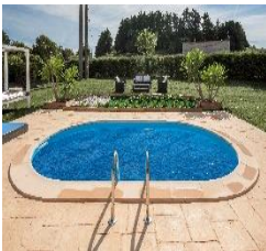
CVPE700 Sommer Abdeckplanne Summer Cover