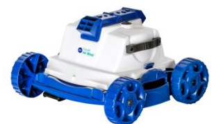
Roboter Robot RKJ14