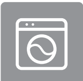
LAVABLE EN MACHINE