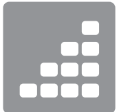
4 NIVEAUX DE CHALEUR