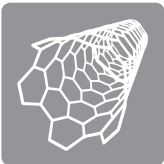
TECHNOLOGIE NANOTUBES DE CARBONE (CNT)