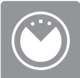
JUSQU'À 18 HEURES DE CHALEUR GARANTIE*