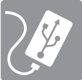
SE BRANCHE À UN BLOC D'ALIMENTATION PORTABLE USB