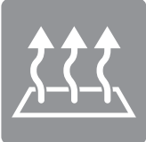
ZONES DE CHALEUR MULTIPLES