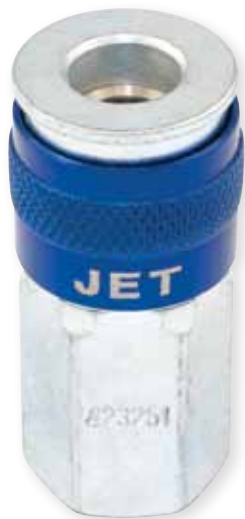
RACCORD FEMELLE "U"