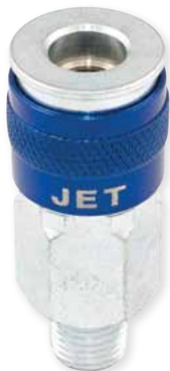
RACCORD MÂLE "U"