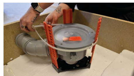
3. Fixera golvbrunnen genom att dra åt spännbandet.