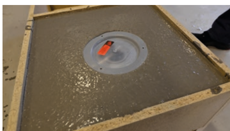
11. Golvlutning mot golvbrunnen ska utföras såväl i underlaget för tätskikt som i ytskiktet. Bakfall får inte förekomma i någon del av utrymmet.