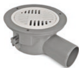
PS 75 FLEX MP RSK 7110787