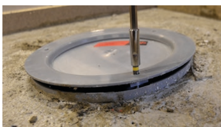
8. Justera till önskad höjd, max 15 mm. OBS! Skruvarna får endast justeras med handverktyg.