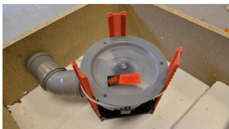
4. Kontrollera att den justerbara delen på golvbrunnen är ihopskruvad i sitt lägsta läge runt om. Klar för gjutning.