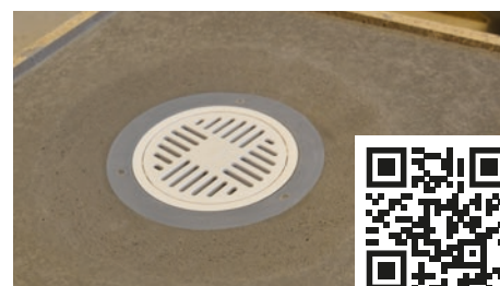
12. Säkerställ korrekt fallbyggnad, tätskikta enligt tätskiktleverantörens anvisning. Se monteringsanvisning för Jafo golvbrunnar för detaljer om montering av klämring m.m.