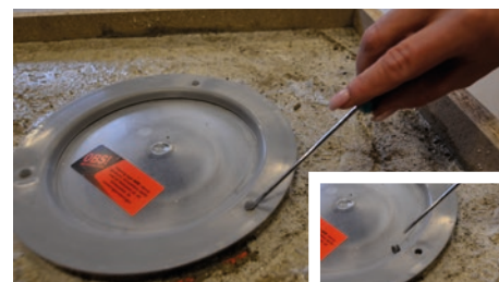
6. Ta bort pluggarna för att kunna justera golvbrunnen.