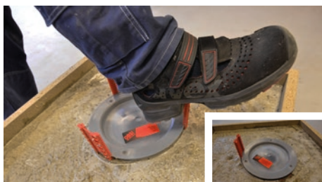
5. När betongen har stelnat, bryt eller slå av de delar av låsarmarna som sticker upp.