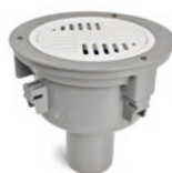
PB 75 FLEX MP RSK 7103789