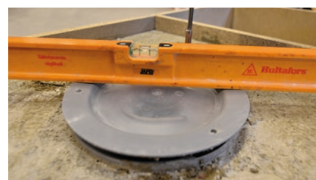
9. Se till att golvbrunnen är i våg. Ovan delen kan vinklas med upp till 4°.