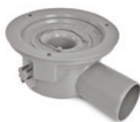
PS 75 FLEX UMP RSK 7110788