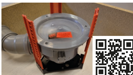
2. Placera golvbrunnen i fixturen. Se monteringsanvisning för golvbrunnfixturen via QR-kod.