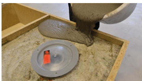
10. Prima golvet samt blanda och lägg på avjämningsmassan enligt spackelleverantörens anvisningar.