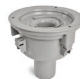
PB 75 FLEX UMP RSK 7103790