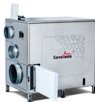
Avfuktarens filter kan bytas snabbt och enkelt genom separata luckor. Man slipper koppla bort kanaler eller demontera serviceluckor.