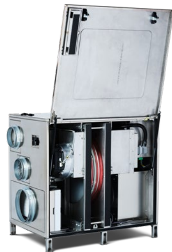
Luckan hålls stängd med två kompressionslås och kan öppnas utan användning av några verktyg. Det ger en snabb och enkel åtkomst till rotor och komponenter.

A15 har ett brett arbetsområde och passar utmärkt för avfuktning vid större vattenskador eller byggavfuktning. Den passar också utmärkt i fasta avfuktningssystem för att kontrollera fuktclimatet i exempelvis lager, förråd eller större vattenverk.