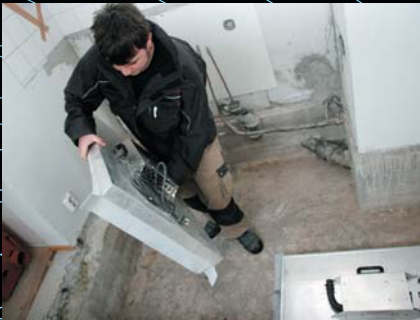
KorVent-tasokuivain on kevyt kantaa ja asentaa jopa yksin.

KorVent-tasokuivain voidaan asentaa lattiaihin, seiniin ja kattoihin pulttaamatta ainoastaan yhden asentajan toimesta. Laite toimitetaan käyttövalmiina eikä siihen tarvitse asentaa erillisiä letkuja.