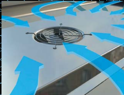
Edistyksellinen tekniikka perustuu tehokkaaseen ilmankiertoon.