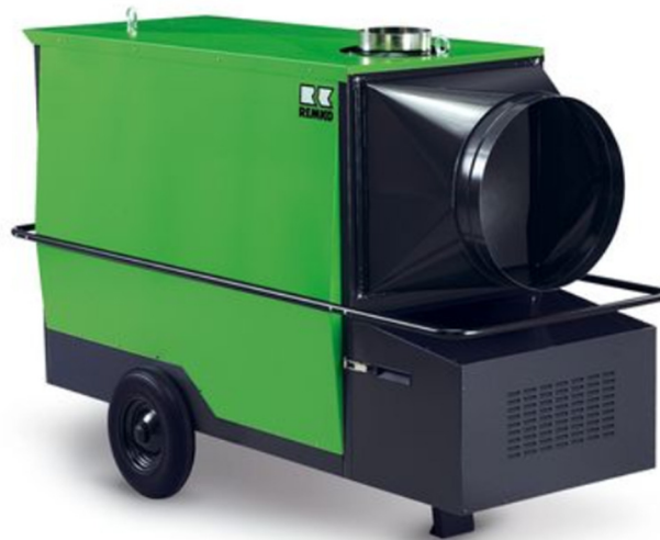
Polar Climat 120-150