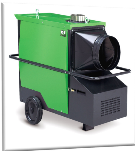
Polar Climat 50-70