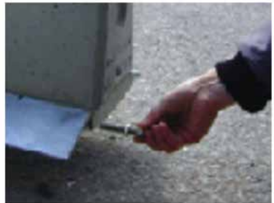
Bultarna förs in vid lossningen

När elementen placeras ut förs den patenterade kopplingen in i stålkärnan. Närmast basen kan elementen riktas in mot varandra med hjälp av en stålstång. Innan elementet sätts ned helt är det viktigt att sträcka elementkedjan något.