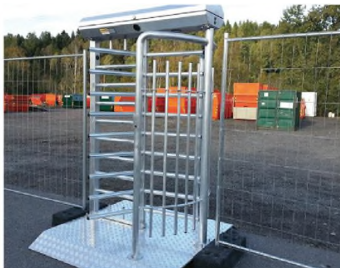
Produkterna på bilden kan vara extrautrustade