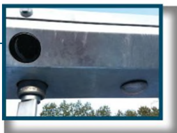
I portens tak finns ljus, såväl som ljus för riktningar.