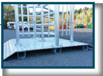
Leverans som standard med stålplattan. Finns med skivan eller plattan som har öppningen för elbilen (som på bilden)