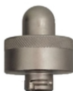
Matriisipidike V1471, matriisi W60M, tuurna W60D.