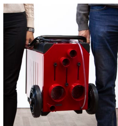
DET VIKBARA HANTAGET på L4 HPW och L4 ES HPW gör det möjligt för två personer att enkelt bära maskinen och fungerar även som ett skydd för display och mätare.

Samtliga maskiner i ES-familjen är kompatibla med SuperVision®, och tillsammans bildar de ett system som är helt unikt på marknaden. Med SuperVision® styrs, mäts och övervakas torkprocessen från datorn, surfplattan eller mobilen.