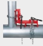
Svetsfixtur för vinklat rör