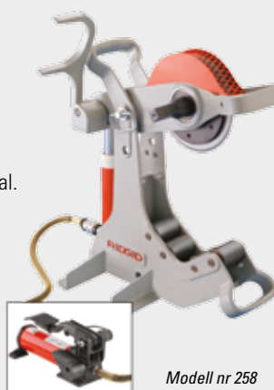
Modell nr 258