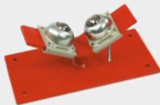
Rörstöd med kulhuvud