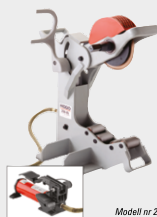
Modell nr 258XL