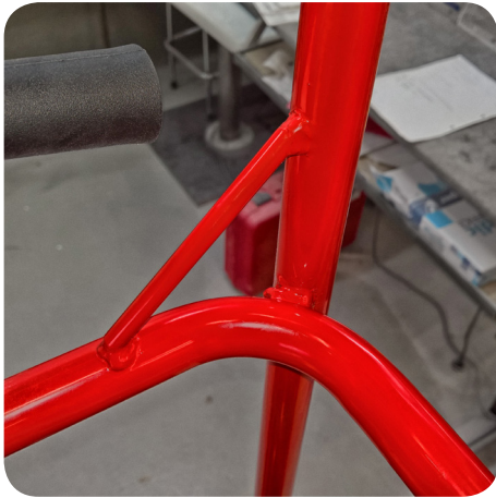
TURVAVALJAIDEN KIINNITYSPAIKAT EN 280/2013 3kN VOIMA