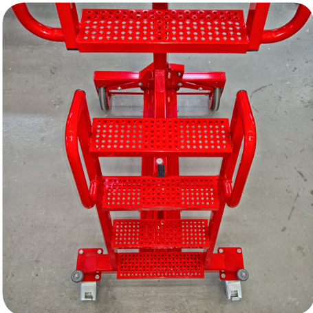
TURVALLISET PORTAAT EN 1004/2004