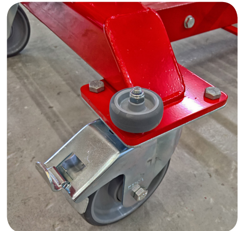
KESTÄVÄT PYÖRÄT JA SUOJAA ANTAVAT KULMAPYÖRÄT

RAMIRENT FINLAND OY Tapulikaupungintie 37 00750 Helsinki Vaihde 020 750 200