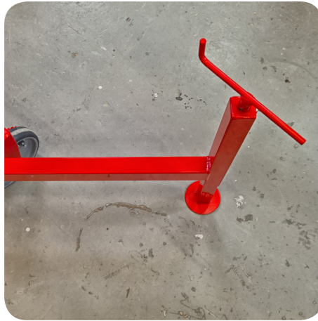
TUKIJALAT MAHDOLLISTAA ULKOKÄYTÖN EN 280/2013 12.5 M/S TUULI