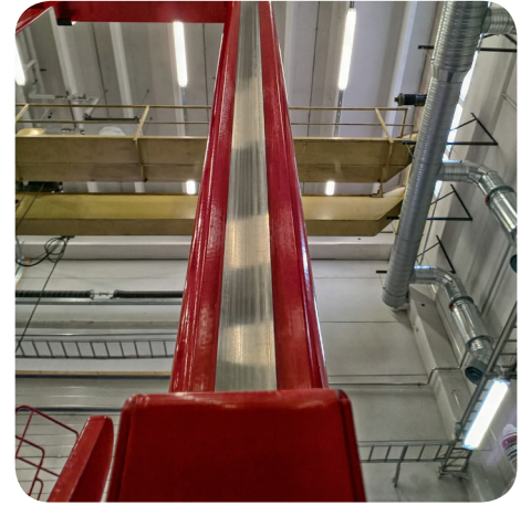
AUTOMAATTINEN SORMISUOJA (LISÄVARUSTE)