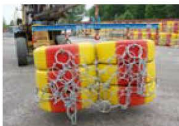
Lyftok måste användas vid transporter.