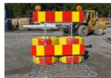
Trafikbuffert 80 med matta.