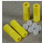
2812 Raccordi di compressione per tubi EFTE per collettore HPLC Poly I raccordi a compressione, venduti in set di sei, sono adatti a tubi con parete dura con diametro esterno di 1,6 mm. Includono ghiera per un adattamento a compressione alla linea di scarico.