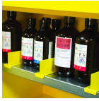
Divisores de Prateleiras de Aço