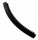
431 SkywalkerHD i-Curve™ Safety Ramp

Los accesorios SkywalkerNitrile HD™ con un diseño ergonómico de burbujas y compuestos de caucho a juego.