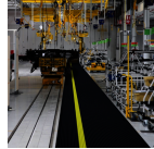
469 Skywalker HD Marking Line™

Los accesorios SkywalkerNitrile HD™ con un diseño ergonómico de burbujas y compuestos de caucho a juego.